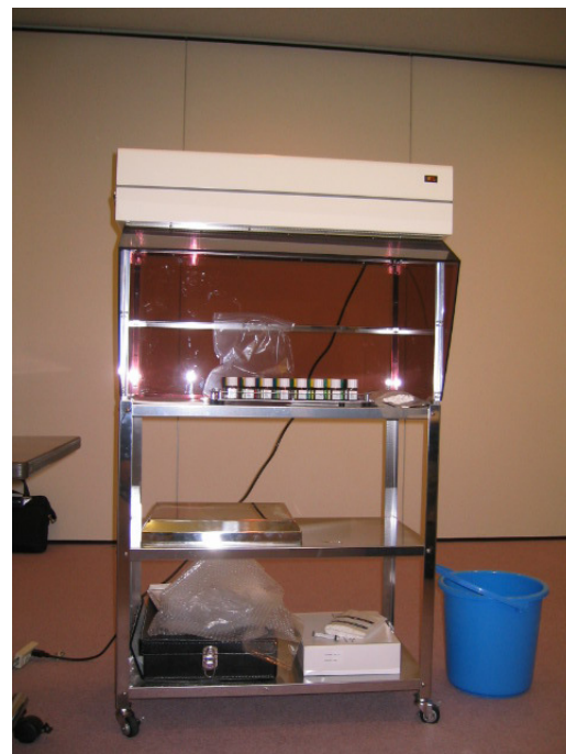
T & T オルファクトメーターおよび脱臭装置 S D-1